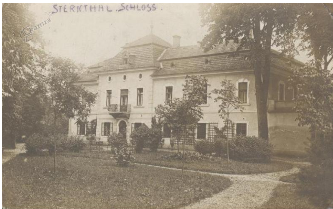
Slika 3: Grad Sternthal