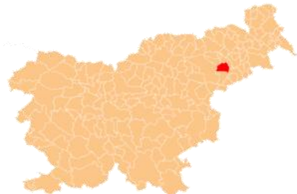
Slika 4: Občina Kidričevo

Občina Kidričevo leži v kulturno, naravno in gospodarsko raznolikem okolju.