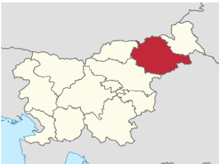
Slika 1: Podravska regija

Podravska regija obsega 10,7 % slovenskega ozemlja oziroma 2,170 km 2 in ima ugodno geostrateško lego, v kateri je dobro razvita prometna infrastruktura, kar zagotavlja dobre povezave z ostalimi regijami.